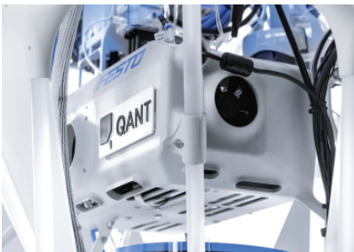
Quantum sensor: Optical real-time determination of biomass