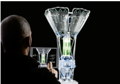
Augmented reality application for mobile devices